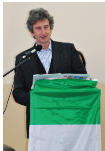
SINDACO DI LECCE PAOLO PERRONE